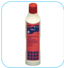
Opakowanie: - Butelka 750 ml (PL12)