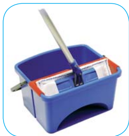
Opakowanie: - Karton zawierający: Wiadro z prasą, uchwyty nakładki, drążek aluminiowy oraz nakładkę (XPB1R)

Nakładka Silnie absorbująca 30cm nakładka z mikrofazy znacznie podnosi jakość oraz wydajność pracy