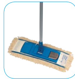
Opakowanie: - Drążek - 1 szt (AH25) - Uchwyt - 1 szt (KRH4N) - Nakładka - 1 szt (RTX4S) - Komplet (drążek + uchwyty + nakładka) - 1 szt. (RASANT)