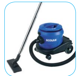
Opakowanie: - 1 szt. (FBV10)

- do odkurzania na sucho - odkurzacz wyposażony jest w 4-stopniowy system filtrowania, 2-warstwową torbę filtrującą, filtr ochronny silnika, filtr powietrza wylotowego maksymalizujący zatrzymanie kurzu i minimalizujący wydychanie kurzu w powietrze - duża moc ssania w połączeniu z mobilnością daje w rezultacie doskonałe efekty odkurzania