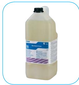
Opakowanie: - Kanister 10 l (300452)