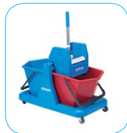
Opakowanie: - 1 szt. (DFT18)

Zestaw składa się z: - podstawy jezdnej z kółkami prowadzącymi - 2 wiaderk wykonanych z PE - w kolorach: niebieskim i czerwonym - prasy wertykalnej wykonanej z PCV