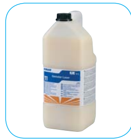
Opakowanie: - Kanister 5 l (302217)