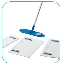
Opakowania: - Uchwyt nakładek (RTH4H) - Rasantec® Mono Star (RTS4M) - Rasantec® Duo Star (RTS4D) - Rasantec® Trio Star (RTS4T) - Drążek Z (ZAS25)

Trzy nakładki do wyboru w zależności od zadania: Rasantec® Mono Star do podłóg o powierzchni do 20 m 2 Rasantec® Duo Star do podłóg o powierzchni do 40 m 2 Rasantec® Trio Star do podłóg o powierzchni do 60 m 2 - nakładki rasanTEC® mają 700 gwarantowanych cykli prania przy przestrzeganiu zaleceń producenta odnośnie prania