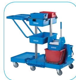
Opakowanie: - 1 szt. (PBB2P)

Zestaw z wózkiem dwu-wiaderkowym z prasą wertykalną do zmywania powierzchni za pomocą mopa płaskiego, z kuwetami oraz uchwytami na akcesoria i środki chemiczne. W skład zestawu wchodzi: - podstawa jezdna - 2 wiaderka 15 l - 2 wiaderka 6 l - prasa wertykalna - kuwety na akcesoria - stelaż na worki 2 x 70 l