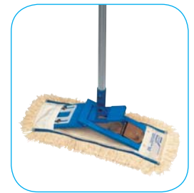
Opakowanie: - Drążek - 1 szt (AH25) - Uchwyt - 1 szt (KBH4N) - Nakładka - 1 szt (BLB4S)